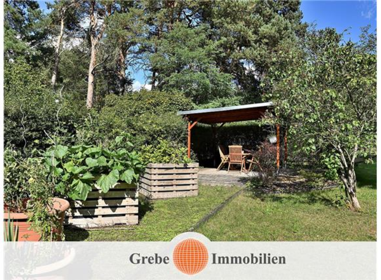
Ruhe und Erholung