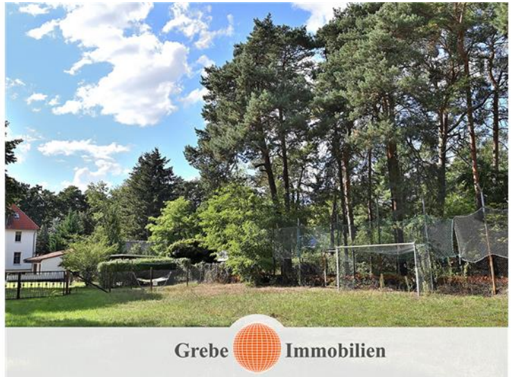
Sportplatz Bild 2