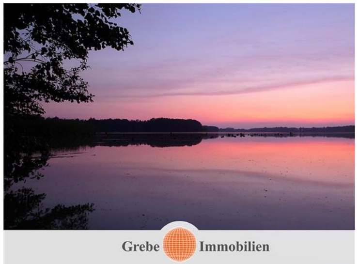
Sommerabend am Wünsdorfer See