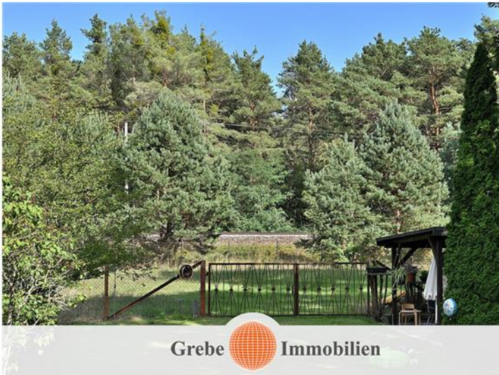
Sportplatz hinter dem Tor