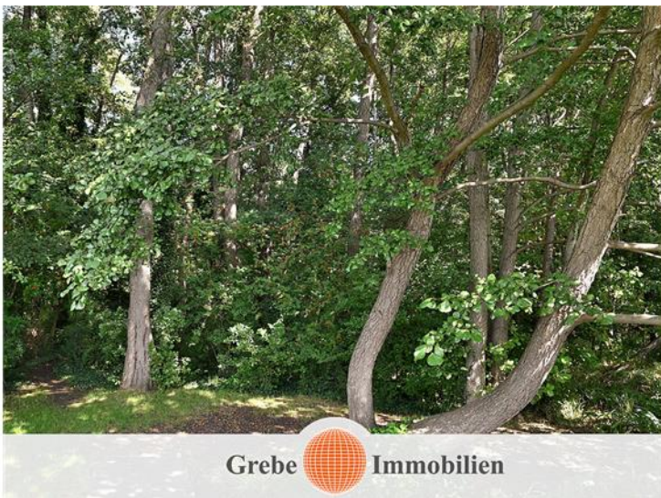
Wald am See